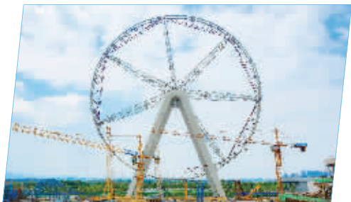
华侨城欢乐滨江摩天轮顺利合圆