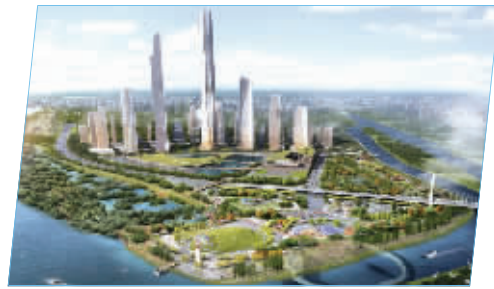
鱼嘴城市客厅规划图