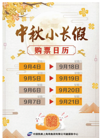
购票日历

中国铁路上海局集团有限公司整理出购票小技巧。注意查询起售时间。不同车站的起售时间不同,一定要提前定好闹钟。打开铁路12306App,点击首页的更