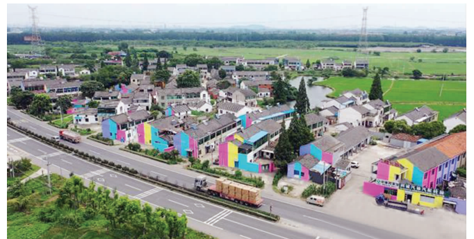
从312国道望过去,马陵村如同童话世界

快报讯(通讯员 萧也平 旦平 记者 曹德伟) 近日,途经镇江丹阳经济开发区马陵村的车主惊喜地发现,沿着312国道,两侧的村庄墙体焕然一新,五彩缤纷的颜料将墙染成一面面无比吸睛的彩虹墙,成为一道亮丽的风景线。