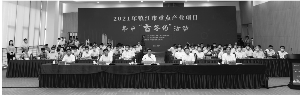
“云签约”活动现场

现代快报记者了解到,这是镇江年内举办的第二场重点产业项目“云签约”活动。此次签约体量大、投资方实力强、产业契合度高且外资项目多。签约项目中上市公司为投资方的项目有10个,总投资近120亿元;21个项目符合镇江“四群八链”重点产业发展方向,占比达70%,其中,高性能材料、新型电力(新能源)装备、汽车及零部件(新能源汽车)、新一代信息技术产业项目均在3个以上;9个外资项目总投资达13.26亿美元,其中7个总投资在1亿美元以上。