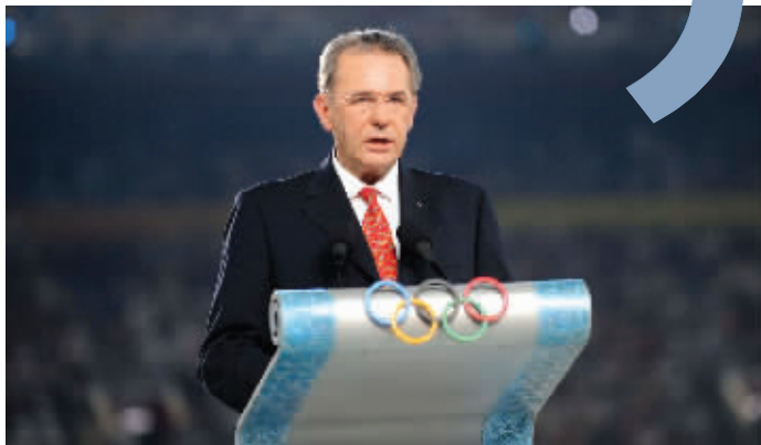
2008年8月8日,罗格在北京举行的第29届夏季奥林匹克运动会开幕式上致辞