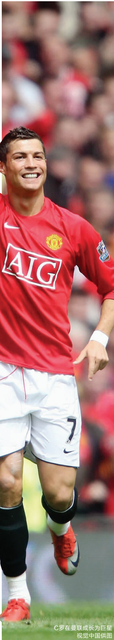
C罗在曼联成长为巨星