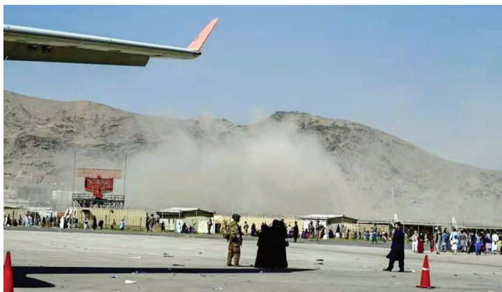
这是8月26日在阿富汗喀布尔机场拍摄的爆炸产生的烟雾(手机拍摄)