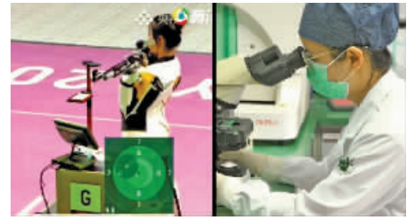
医院检验师快速检测，像射击场上的杨倩一样精准