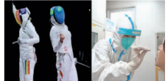
检测一签抵咽，如同奥运击剑冠军孙一文向前刺剑，既精准又高效