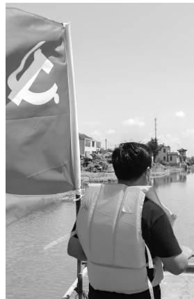
汤庄镇渔船巡逻队在巡逻