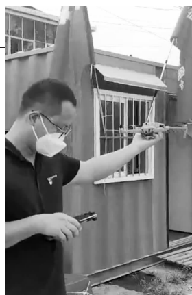
工作人员用无人机进行防控巡逻