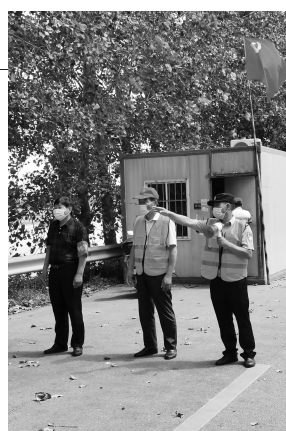
射阳湖老党员红色“边哨”