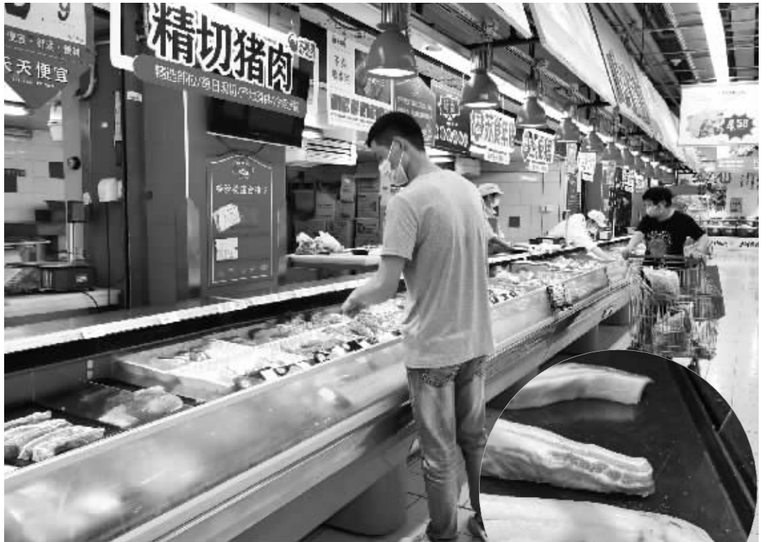
▲超市的猪肉柜台前，市民正在选购 ▶购买猪肉时，先确定有没有检疫印章

选购时要仔细查看猪肉表皮。一般来说，健康的猪肉表皮没有疤痕，表面光滑、没有那么多毛发，且呈现的颜色一致，不会一块红一块紫甚至有一些细小的红斑点。除了猪肉表皮，还要看内里的肌肉。肌肉首先要颜色红润，没有暗红色的血液渗出，且没有发乌的颜色出现，