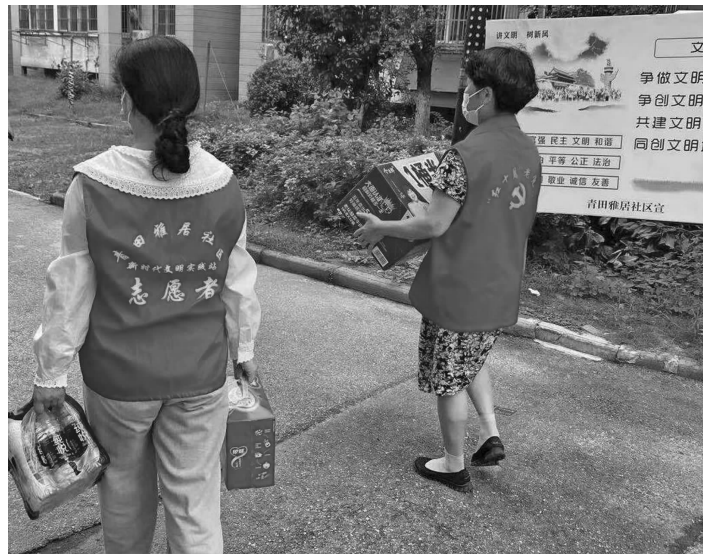
志愿者将物资送上门