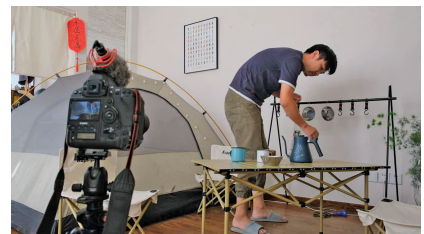
张先生在搭帐篷布置背景