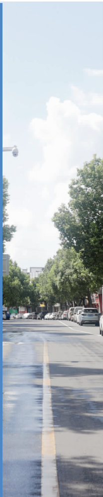
安静的街道