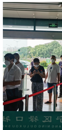
市民到社区医院就诊