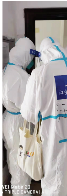
志愿者协助核酸检测