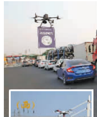
无人机“上岗”

快报讯(通讯员 箫剑 单娟 记者 姜振军)“请扫行程码，前方检查；请扫行程码，前方检查……”8月2日，盐城高速盐城南出口的上空，一架无人机上悬挂着二维码缓慢飞行，用亲切的声音提醒入城车辆驾驶员快速扫码通过防疫检查。现代快报记者了解到，盐城警方在6个高速口都安排了这样一架无人机，大大提高了通行效率。