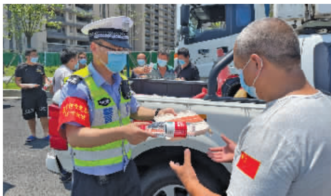
民警给司机们送来盒饭和矿泉水