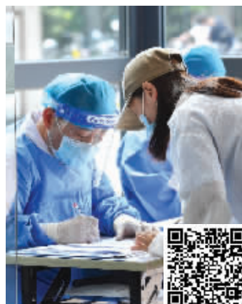
医院预检分诊点(扫码看视频)