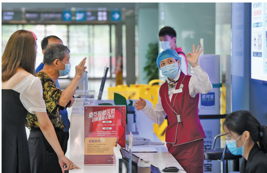
扫健康码进院、间隔入座、有序咨询……南京鼓楼医院本部恢复门诊,秩序井然