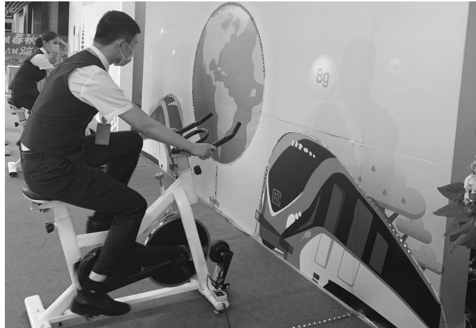
常州地铁碳减排账户上线仪式现场

共享的有常州、苏州、无锡、南昌,使用上述任一城市轨道交通官方App在共享城市乘坐地铁,均可获得相应碳减排量,共同接入乘客碳减排账户。