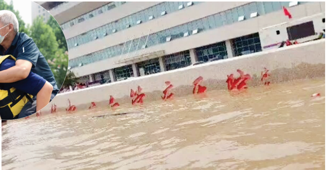
医院被洪水包围