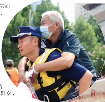
来自江苏的消防队员背起被困群众撤离

截至22日17时,江苏消防救援队伍共执行40起救援任务,出动89辆消防车,449名指战员、51艘舟艇,疏散769名群众,累计排水93万立方米。截至发稿时,救援行动还在紧张进行中。