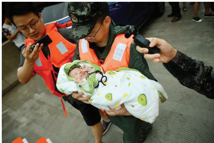
刚满月的婴儿获救