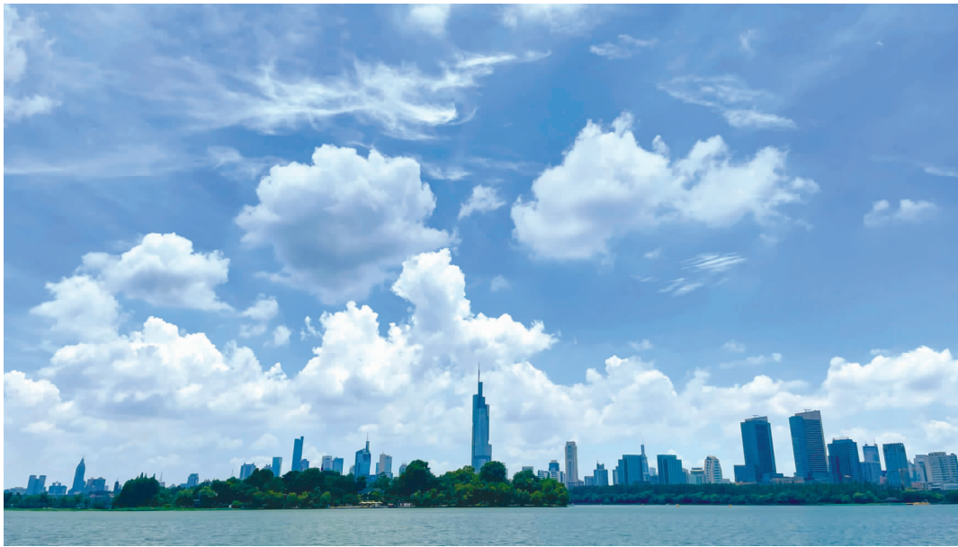
蓝蓝的天上白云飘,昨天,南京的水晶天美爆了