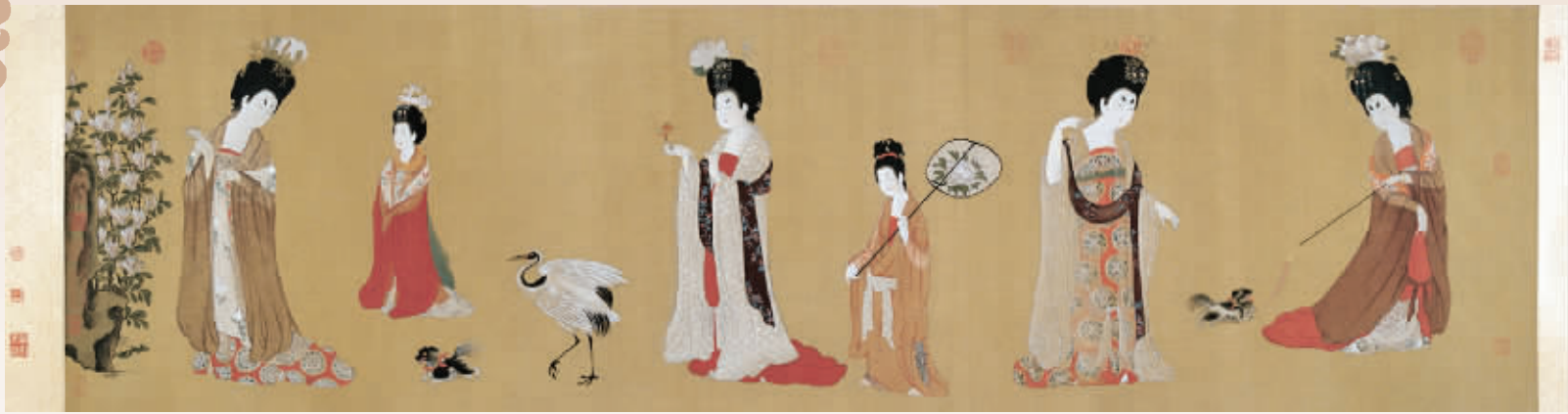
唐 周昉《簪花仕女图》