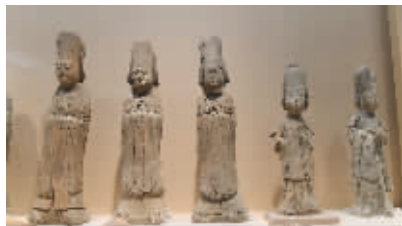
南唐 宫官女俑 南京博物院

现在不少女孩子喜欢穿帅气的男装，其实，这种风俗在唐朝就盛极一时。当时有些唐朝女子外出，上身便穿着男袍或男衫，下边穿一条小口裤，既帅气又方便。 有一段时间，中原还兴起了一股“胡服热”，尤以首都长安及洛阳等地为盛。当时走在大街上，你能看到不少女孩子戴着锦绣帽，穿着窄袖袍、条纹裤，脚踏软锦靴，英姿飒爽。