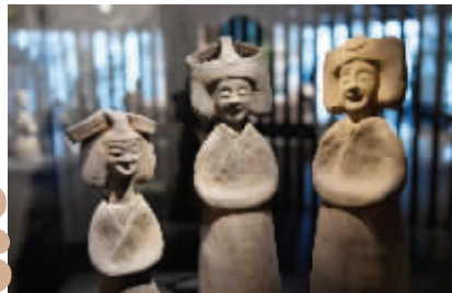
六朝女陶俑 六朝博物馆

——你们三姐妹看着挺乐呵，有啥开心事？ ——被人夸了，可不得开开心心！有人说我们颇有“林下风气”，贤德、有胆识、通达沉稳。