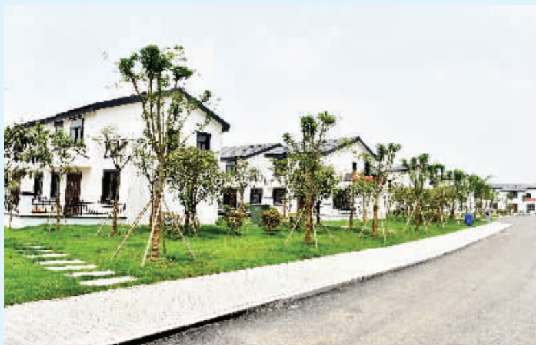
南房村新型社区一角