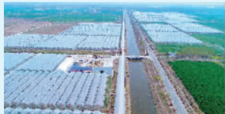
农业产业园