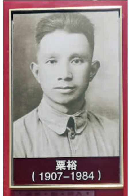
“百年征程 初心永恒——中国共产党在江苏历史展”上展出的粟裕照片