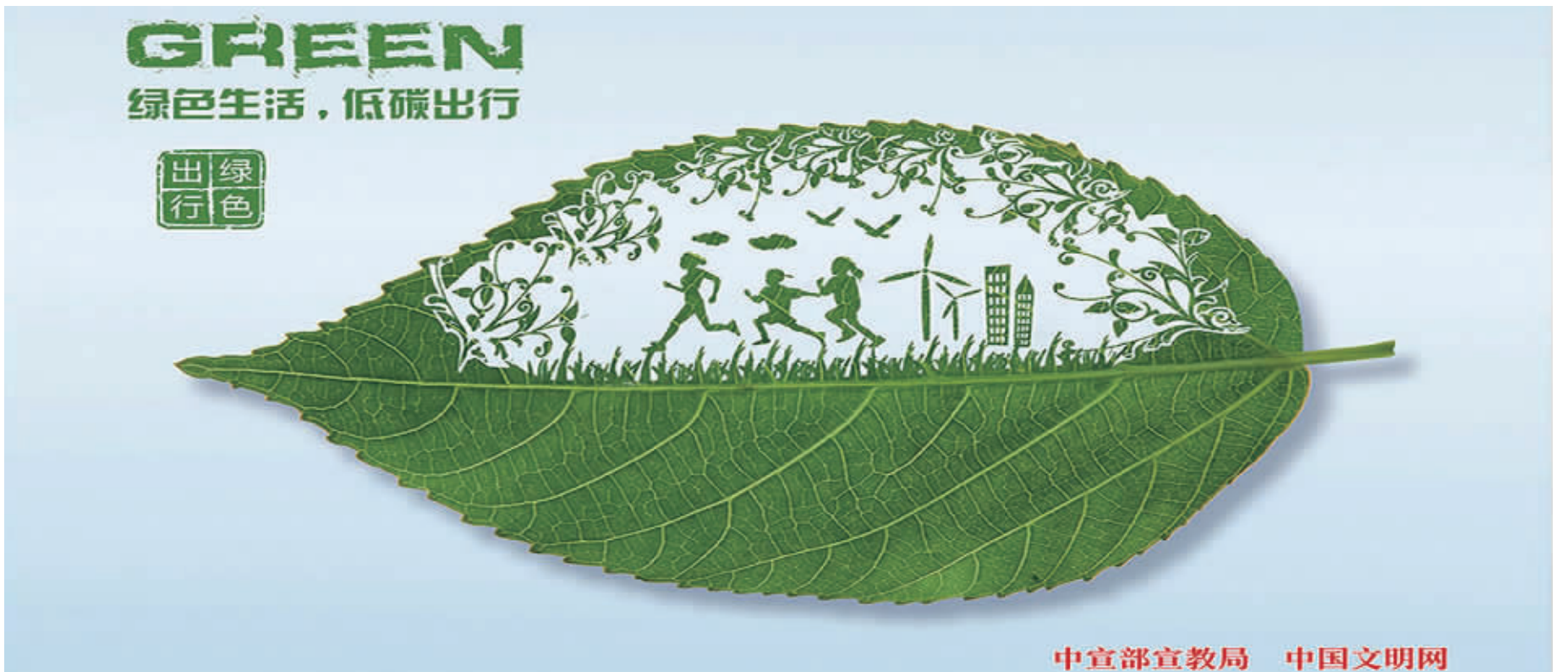
中宣部宣教局 中国文明网