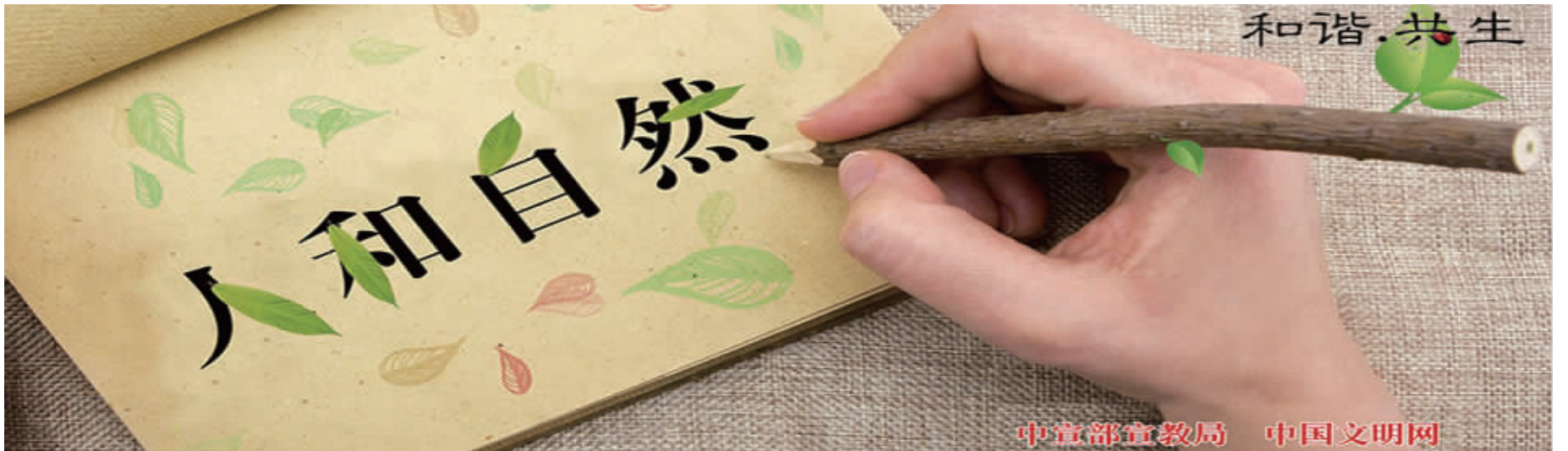
中宣部宣教局 中国文明网