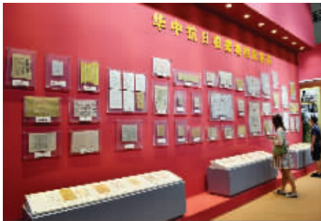
华中抗日根据地档案集萃