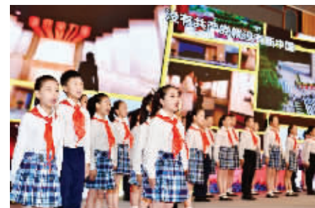
“党的故事我来讲”,40多名红领巾讲解员上岗

“电视剧中的主要角色陈乔年、陈延年牺牲并且安葬在龙华。这部电视剧的播出掀起了更广泛地对英烈的祭扫。”参会间隙,上海市龙华烈士陵园(龙华烈士纪念馆)主任、馆长邹强在接受现代快报记者采访时表示,今年以来,纪念馆“涨粉”迅速,去年入园人数100多万,仅今年1到6月上旬,龙华烈士陵园入园人数已超100万人次。纪念馆的微信、微博6月就新增了