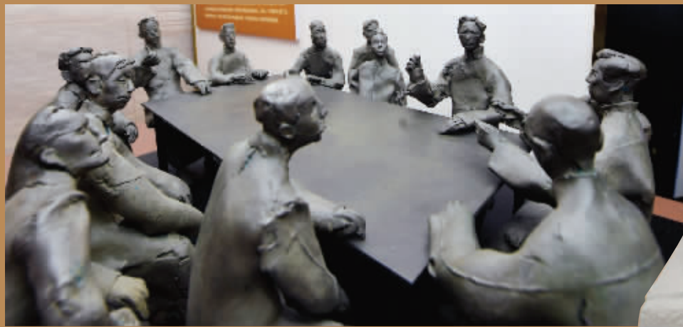
《本党命名为中国共产党》群雕像