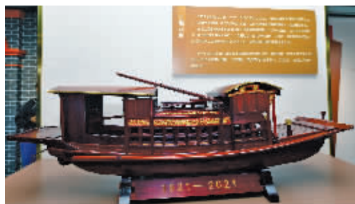
《嘉兴南湖红船》实物模型

旁边一同展出的,还有《嘉兴南湖红船》的实物模型。由于上海的会场受到暗探注意和法租界巡捕搜查,中共一大最后一天的会议转移到浙江嘉兴南湖的游船上举行。