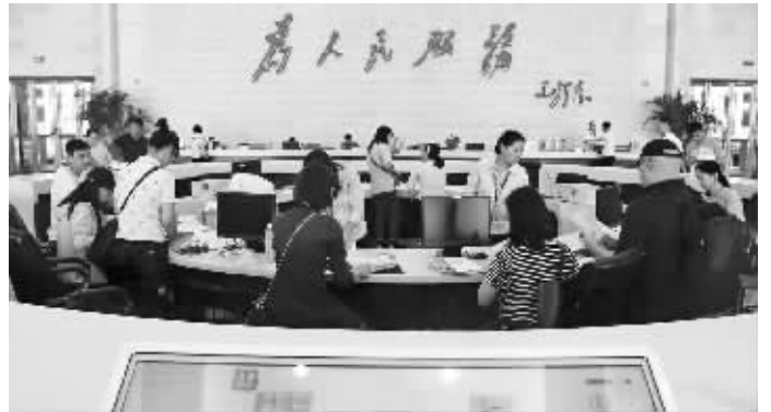
市政务服务中心

“关于打通数据壁垒，实现政府部门信息共享的建议”，是今年被遴选出的南京市领导重点督办件，也是第0485号提案。近日，南京市政协十四届四次会议第0485号提案督办会在市政务服务中心召开，目的是为了进一步推动提案的办理、提高答复的质量和委员的满意度，充分发挥提案在促进惠企政策“免申即享”改革以及优化全市营商环境中的重要作用。