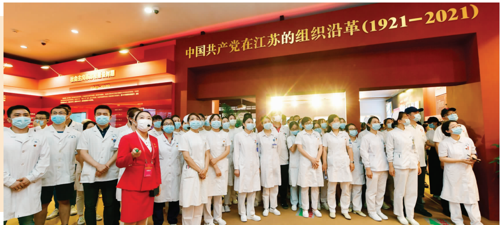
▶ 江苏百名抗疫英雄“重走”逆行路