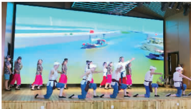
巴斗村文工队在表演节目