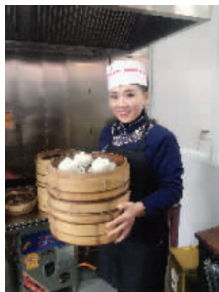
“巴斗渔娘”饭店老板