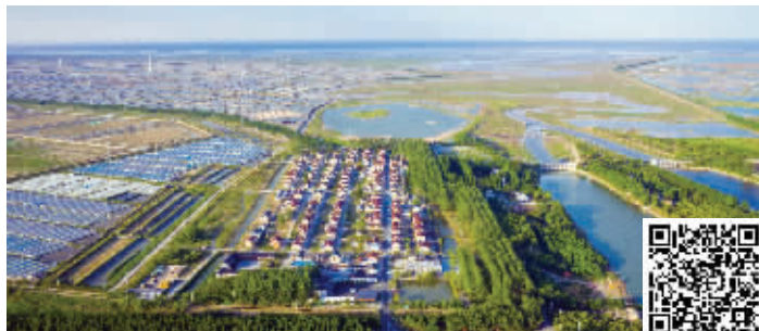
美丽的巴斗村 扫码看视频

坐拥世遗地,满眼尽生态,村里将统筹应用好“海、滩、堤、船、桥、车”等地域特色资源;教育引导好渔民守护好“百沙洲”“海洋蓝”;组织民间艺术团创作《海洋蓝》《滩涂美》《巴斗情》等节目;在今后五年内,村集体资金保持在年增20%的幅度,村民人均年纯收入5万元以上……在叶勇心里,一张更加美丽的渔村蓝图正在悄然铺开。