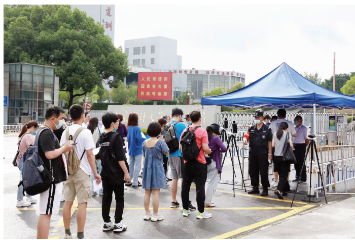
考生排队进入考场

今年江苏“三支一扶”计划继续在苏中、苏北八市实施,并根据各地基层单位对人才的实际需求和往年招募情况编制招募岗位计划,优先征集有空编或者未来2年内有空编的基层单位岗位,以保障“三支一扶”人员服务期满后,通过择优聘用继续留在基层工作。此外,对招募岗位在专业上按大类设置相关要求,部分岗位还设置了具体专业门槛,有效提高招募人员的人岗匹配度。