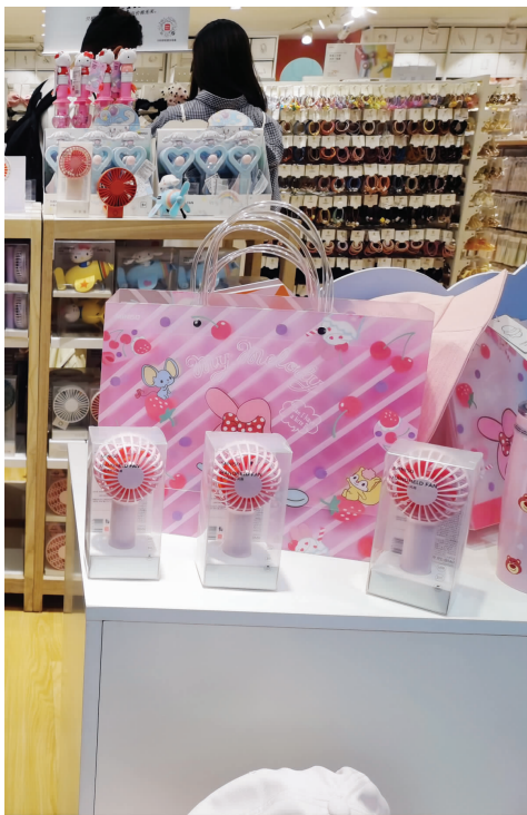
市面上销售的新潮小风扇

长头发的女孩子们,到了夏天最怕的就是看到满头大汗又灰头土脸的自己,于是精明的商家抓住这一点,售卖头皮降温喷雾。不过这款降温喷雾的价格也不便宜,150ml售价在58元左右。商家在产品介绍页中这样宣传,使用喷雾后,头皮表面温度可以下降17.8℃,不仅如此,还能解决头皮瘙痒异味等问题。不过有买家表示,这款产品刚喷在头皮上确实很“透心凉”,但过几分钟就没效果了。