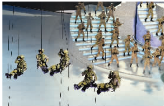
情景歌舞《强军战歌》