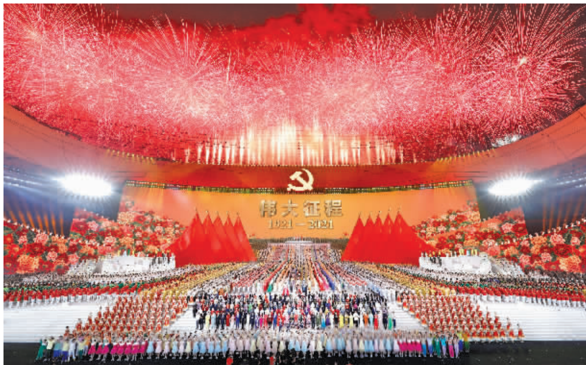
文艺演出结束,全场高唱《没有共产党就没有新中国》