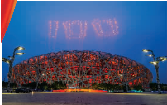
焰火在国家体育场上空盛放