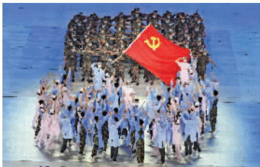
情景交响歌舞《人民至上》