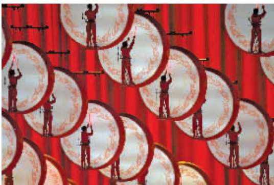
鼓乐歌舞《新的天地》

舞台中央,3000多名红衣青年举起发光道具,组成熠熠发光的党徽;“鸟巢”上空,绚烂的焰火升腾绽放,化作“100”的纪年字样;红色看台上,观众的热情被瞬间点燃,掌声欢呼声响彻夜空。