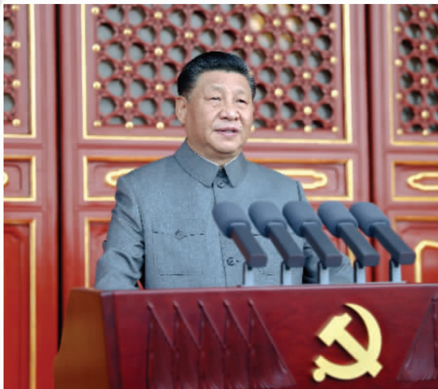
习近平发表重要讲话