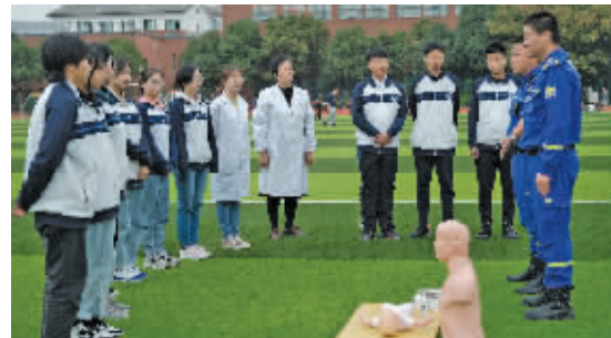
蓝天救援队社团活动