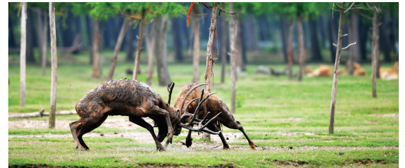
出现在启东的大丰野生麋鹿

快报讯(记者 王菲 通讯员 任义军)近日,江苏大丰麋鹿国家级自然保护区的野生麋鹿跨越约180公里,出现在长江北岸的南通启东北新镇。其体型健硕,鹿角巨大,引来路人的好奇和围观。