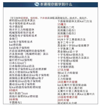
网上兜售的开锁教程

此外,记者发现电商平台除了售卖号称能打开小区公共区域的“通用钥匙”,还在兜售民用锁、汽车锁开锁教程。通过这些教程,可以掌握专业开锁技术、汽车开锁配钥匙、开锁工具制作等。而专业开锁技术可以细分为插片开锁、单钩开锁、技术开锁、猫眼开锁等。