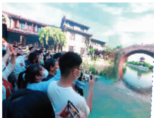
中国大运河博物馆开馆首日,美轮美奂的5G大运河沉浸式体验区迎来众多观众排队打卡