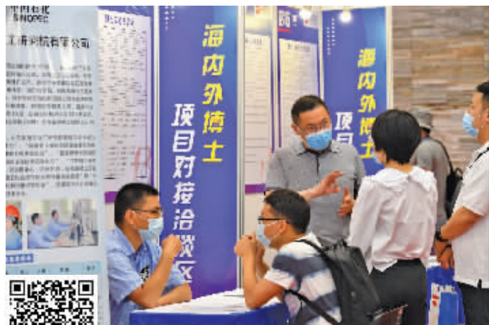
海内外博士项目对接洽谈区

开幕式上,还举行了2021年度“赢在南京”海外人才创业大赛总决赛获奖选手颁奖仪式、南京最具成长潜力留学人员创业企业和最具影响力留学人员颁奖仪式等。受疫情影响,很多海外机构未能到现场参会,他们在开幕式上为留交会上送上了视频寄语。留交会开幕式进行了现场图文直播,超过35万人次在线观看。