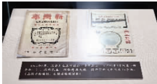
陈独秀主编的《新青年》《青年杂志》复制件