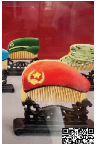
非遗文创品十分有趣 扫码看视频

为进一步提高人民群众非物质文化遗产保护意识,传承、弘扬中华优秀传统文化,南京图书馆在第十六个“文化和自然遗产日”到来之际,在江苏省文化和旅游厅的关心支持和厅非遗处的直接指导下,与江苏省非遗保护中心建立联动机制,举办本次活动,向党献礼。