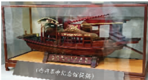
展览现场陈列的南湖红船模型