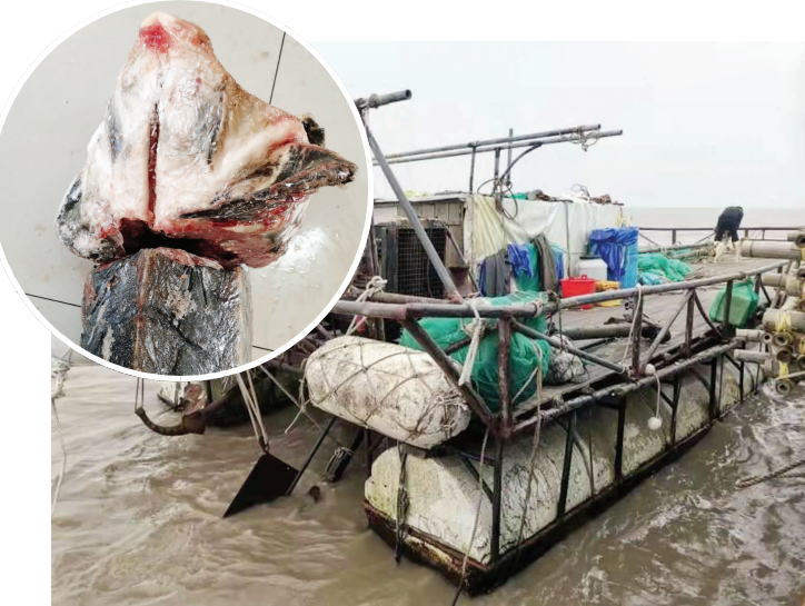
作案船舶浮子筏(大图) 现场查获的部分鱼肉(小图)