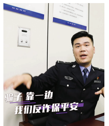
盐城警方反诈MV截图

“大力”通过说唱RAP形式,将冒充公检法、杀猪盘、贷款诈骗等常见的诈骗形式演绎得诙谐有趣,深入人心。MV选择最具典型性的诈骗套路,例如:还有网络美女你一定要防备,白富美和大长腿她都是虚幻泡影。而就在不久前,盐南警方还远赴外省捣毁一个网络诈骗犯罪团伙。