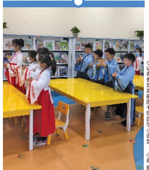
小记者参加高邮图书馆国学小课堂