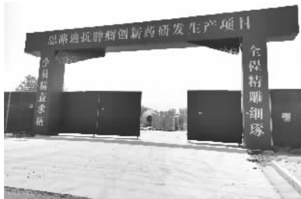
如今,工地门口已挂上别的项目名称