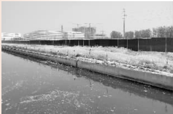
当初约定的智慧医疗中心建设地点,目前围挡还在