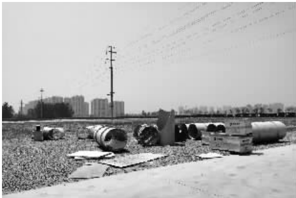
工地上没有动工迹象