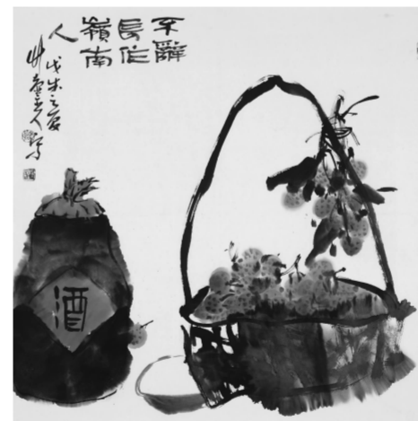
《不辞长作岭南人》68×68cm 2018年