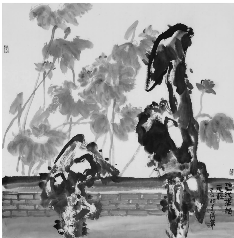
《碧池香韵一风轻》68×68cm 2019年