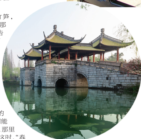
瘦西湖美景

谱写震撼人心的乐曲;只有光明和阴暗的辉映,才得见最美丽的风景;只有悲苦和欢喜的交织,生命才会有绚丽的色彩。