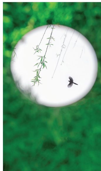
亲近自然

在很久很久以前,在地球的尽头,在热带雨林的尽头,有着这样一座美丽的大山,一年四季都是绿的。所以这儿成了鸟儿们的乐园,每天都有人来这里旅游。