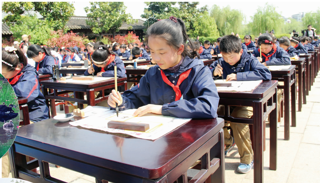
竹西小学书法百人现场

昨天晚上我做了一个梦。有一个花精灵来到了我的教室,对我说:“你好啊,小朋友,你叫什么名字