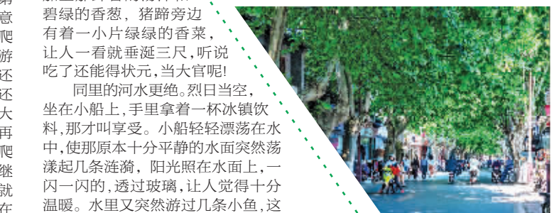
扬州街头绿意盎然