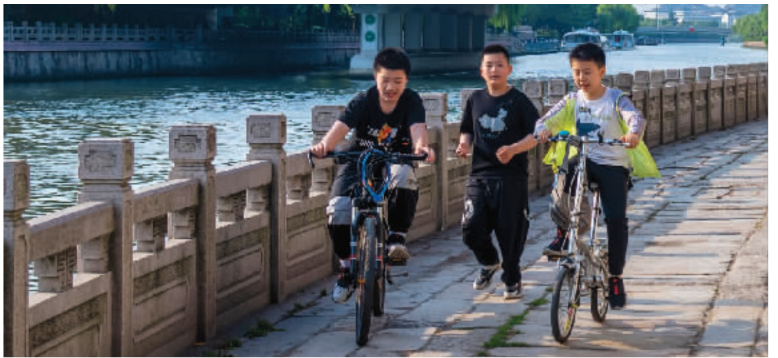
运河边的“比赛”