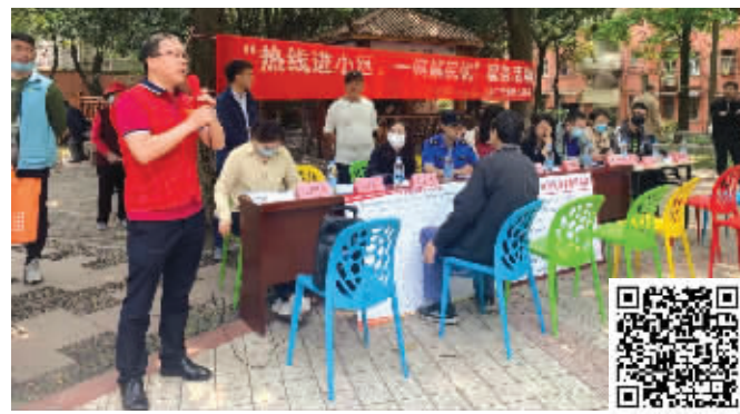
大厂街道“热线进小区”活动现场 扫码看视频

快报讯(记者 刘伟娟)今年4月起,由南京江北新区政务热线中心牵头、大厂街道市民诉求处置中心和社区共同主办的“热线进小区、一网解民忧”活动,就将办公点搬到居民家门口,现场倾听百姓的心声,并现场帮助百姓解决急难愁盼问题。现代快报记者了解到,活动开展以来,大厂街道办事处市民诉求处置中心的12345投诉量开始明显下降,4月份同比2020年下降了15.94%,更重要的是,为民办实事的“最后一公里”大大缩短了。