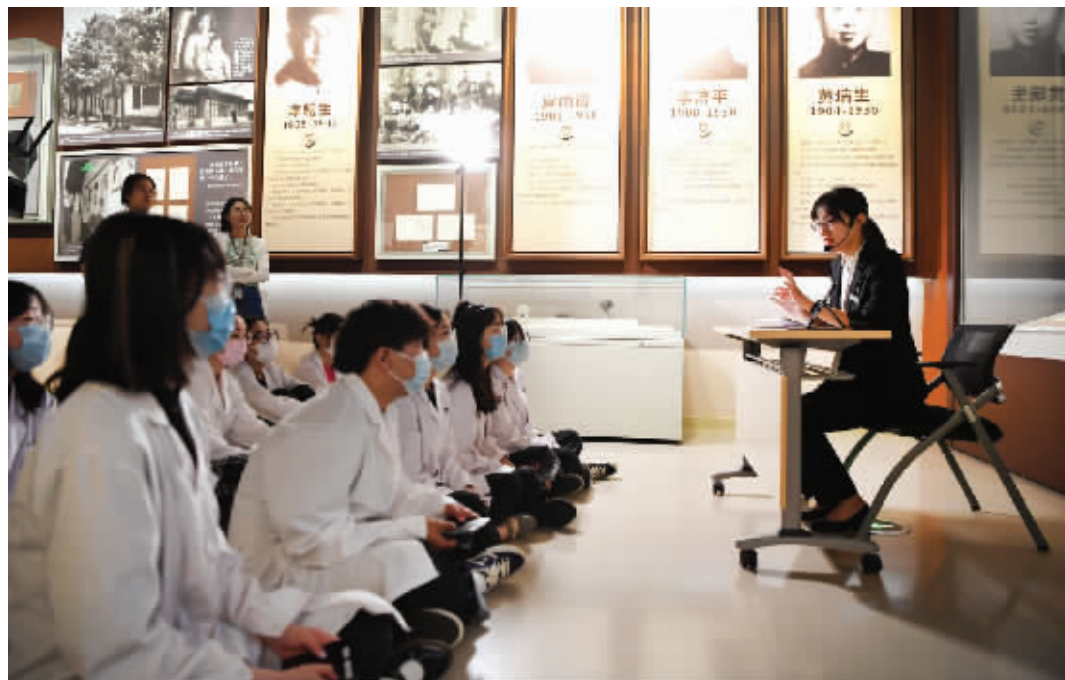
工作人员现场讲解“绘画与结构”