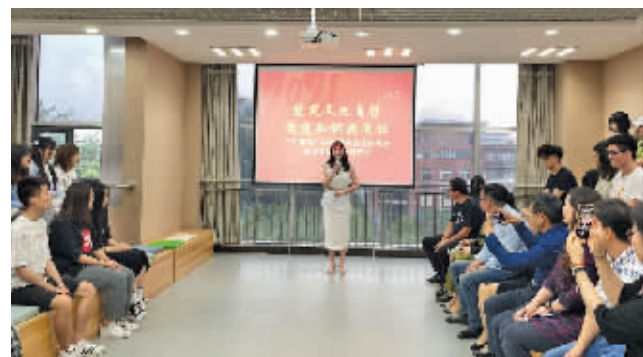
活动现场

快报讯(通讯员 杭茂燕 记者 舒越)5月24日，三江学院2021年经典阅读分享会在图书馆正式启动。首期由网红作家、文新院刘勃老师开讲，分享经典著作《三国演义》中的历史与文化。