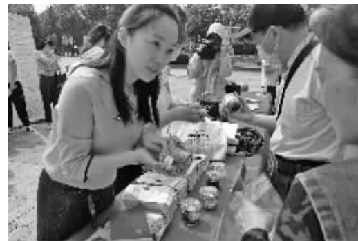
化妆品安全科普宣传活动引来众多市民“围观”

本次宣传周将围绕法规宣贯、儿童化妆品安全使用和化妆品安全使用常识的宣传重点，采用线上线下结合，相关直属单位、重点实验室、行业协会、生产经营企业、电商平台、社会公众等广泛参与的形式。