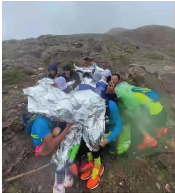
被困在山上的参赛选手 图据封面新闻

户外运动经常会遭遇暴雨,专家介绍,行进中遭遇暴雨时,要根据周围环境、行进路段、雨势的大小、队员的身体状况分析该继续前进还是避雨。继续行进要注意辨别方向,必要时使用安全绳,确保行进安全。避雨应注意保暖,防雷击,防山洪。宿营时遭遇暴雨,要选择安