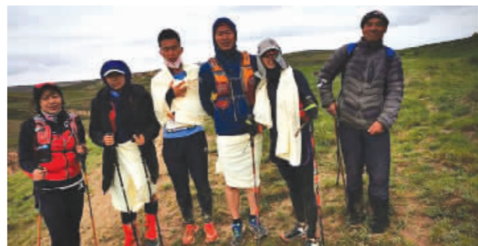
获救选手与牧羊人(右)合影

“由衷感谢朋友们的关心,5月22日甘肃黄河石林百公里马拉松遭遇恶劣天气,起雾、下雨、冰雹、下雪,自救都困难,感谢跑友救了我一条命,感受到了当地村民和组委会热心帮助,在此感谢大家,我安全了,谢谢大家关心!”2021年5月23日上午7时,“小晏香香”(微信名)在朋友圈里发布了这条信息,告诉朋友自己平安。她是参加2021(第四届)黄河石林山地马拉松百公里越野赛的参赛者。记者辗转联系上“小晏香香”。