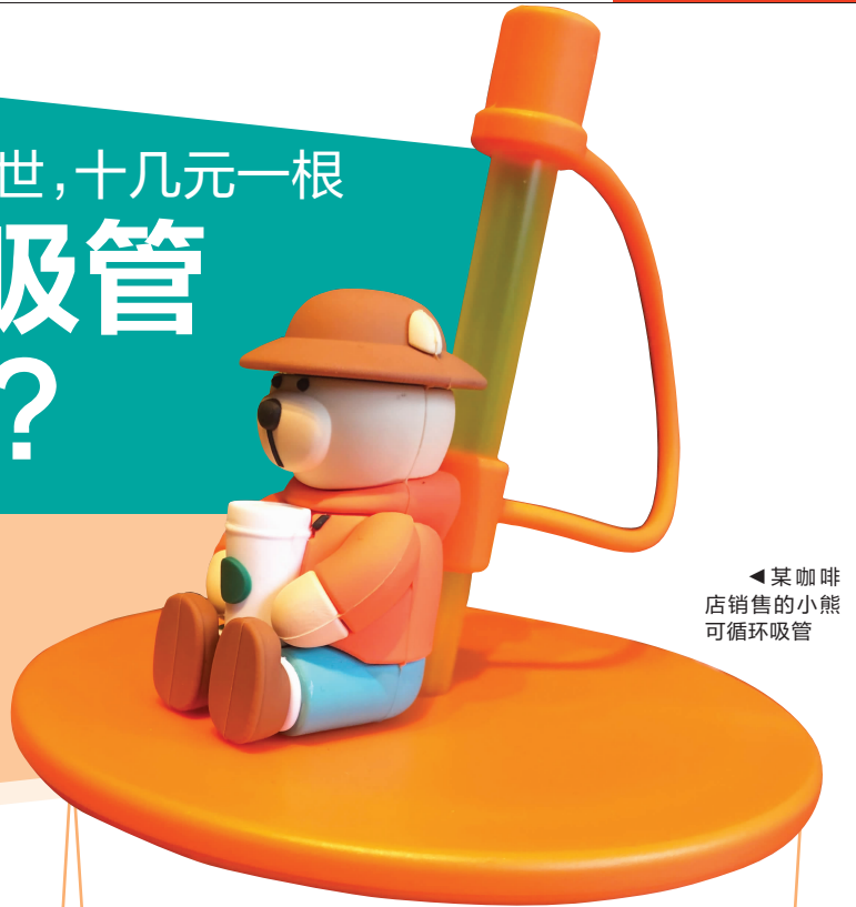
某咖啡店销售的小熊可循环吸管

随着各地限塑令的稳步推进,奶茶店、咖啡店纷纷换上了环保的纸吸管或者PLA吸管,不过纸吸管的口感一直被大家吐槽。近日,现代快报记者了解到,一种兼顾“貌美+环保”的可循环吸管问世,收获了一众“小仙女”的芳心,但这种吸管可不便宜,均价在10元左右。一些限量发售的可循环吸管,甚至引得网友高价求购。你会入手这种吸管吗?