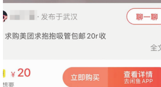
有消费者高价求购免费的可循环吸管 网络截图