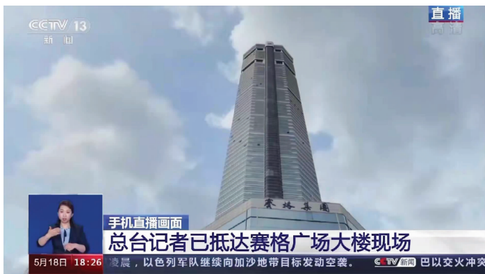
深圳赛格广场

记者从大厦物业人员处了解到,晃动发生后,赛格广场大楼内近一万五千人被紧急疏散。外来人员禁止进入,各出入口都有保安或物业人员值守。据记者了解,每天14时到16时是华强北出货量最大的时候,因此事发时华强北片区人流量已经比较大,所幸没有人员伤亡。