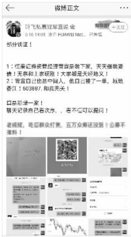
16日,私募大V在微博上称被“追债” 均为截图