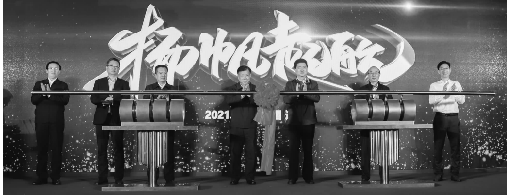
“中小企业服务月”启动仪式

日前,现代快报记者从连云港市2021年度“中小企业服务月”启动仪式暨重点项目专题融资对接会上获悉,今年5月中小企业服务月期间,该市将集中一个月时间开展“四送一服”行动,向全市中小企业送新发展理念、送支持政策、送创新项目、送生产要素,为中小企业健康成长提供全方位服务。