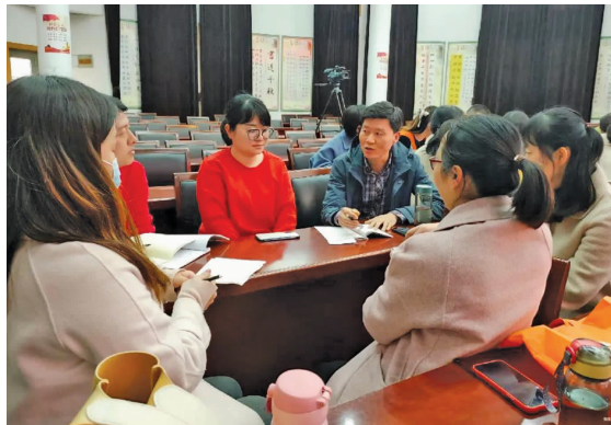
聚焦“写作教学”突破,助力名师素养提升