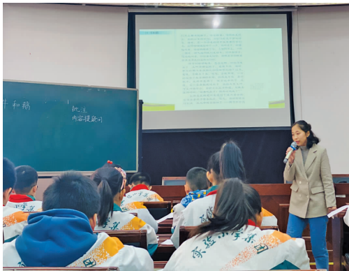
聚焦教学语言,提升专业素养

为了不断提高学校语文教师课堂教学水平,夯实教师驾驭课堂教学的基本功,扬州市宝应县实验小学(简称宝应实小)将教学研讨活动变成常态化。