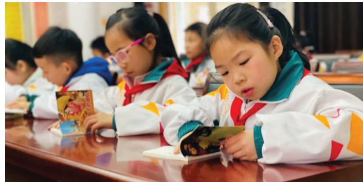
同学们在阅读红色书籍

4月16日上午,宝应县图书馆与宝应实小联合举办了“阅读红色书籍 传承英雄精神”馆校联盟“红色连环画”读书会。