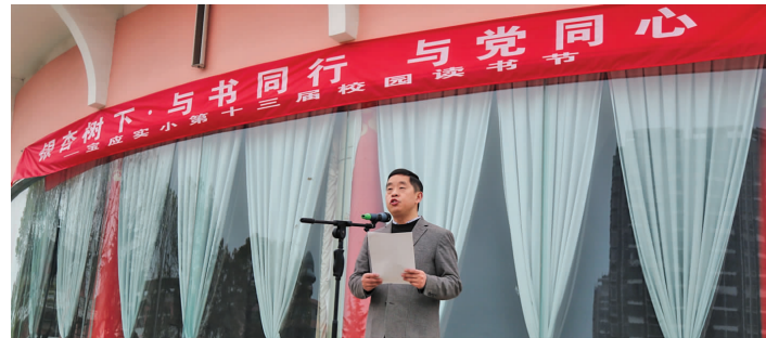
与书同行 与党同心读书节开幕